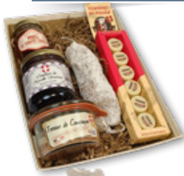
>La P'tite Tournette*