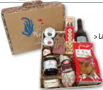
> La P'tite Maci*

(Maci, signifie « grand merci » en Patois Savoyard)