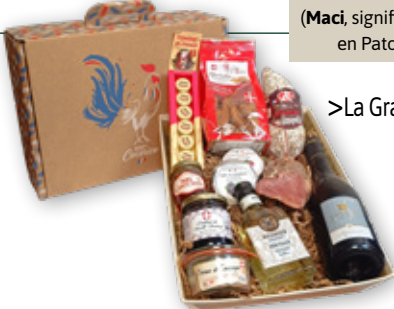
>La Gran Maci*

(Maci, signifie « grand merci » en Patois Savoyard)