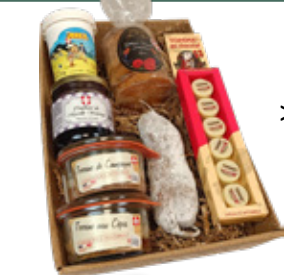
>La Gran Tournette*